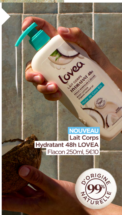
NOUVEAU Lait Corps Hydratant 48h LOVEA Flacon 250ml, 5€10

Le sable, le chlore, le sel de la mer... c'est peu de dire qu'en été, la peau du corps est particulièrement mise à rude épreuve. Alors oui, le soir venu et après une belle journée où on a profité d'une séance bronzette, on opte volontiers pour un après-soleil (LOVEA en propose d'excellents d'ailleurs), mais pour apporter à la peau un maximum de douceur, on double la mise en appliquant chaque matin ce lait corporel au divin parfum. Enrichi en huile de coco biologique, il apporte à la peau 48h d'hydratation, procurant une sensation de confort, sans effet gras ou collant. Sa formule sans silicone est convaincante et, d'ailleurs, même l'exigeant Yuka n'y trouve rien à redire : la note est excellente avec un joli 92/100. Ce produit a aussi l'avantage d'être fabriqué en France et d'être composé d'un emballage majoritairement recyclable.