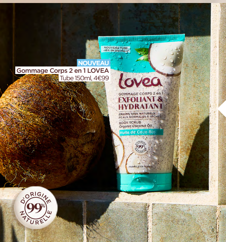
NOUVEAU Gommage Corps 2 en 1 LOVEA Tube 150ml, 4€99